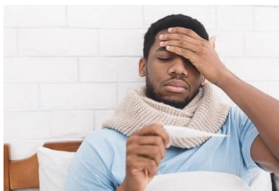
Fiebre de 100.4° o más